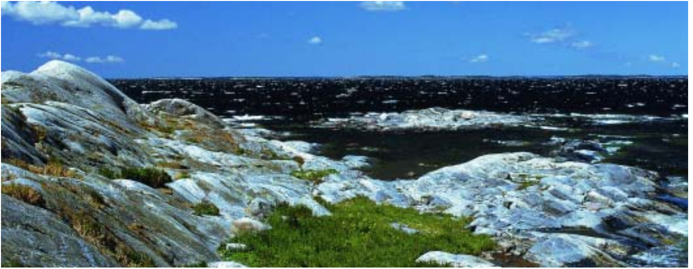
Klippekyst ved Østersøen i det sydvestlige Finland.