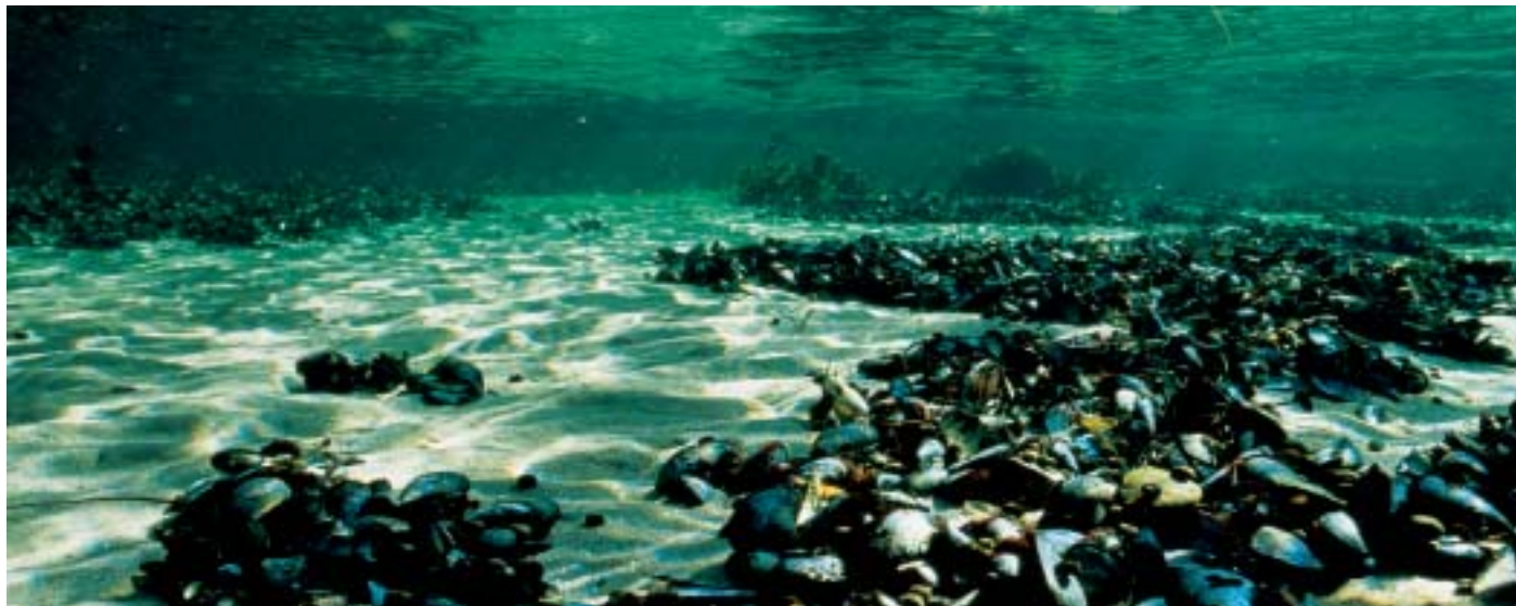
S. E. Jørgensen / Biofoto